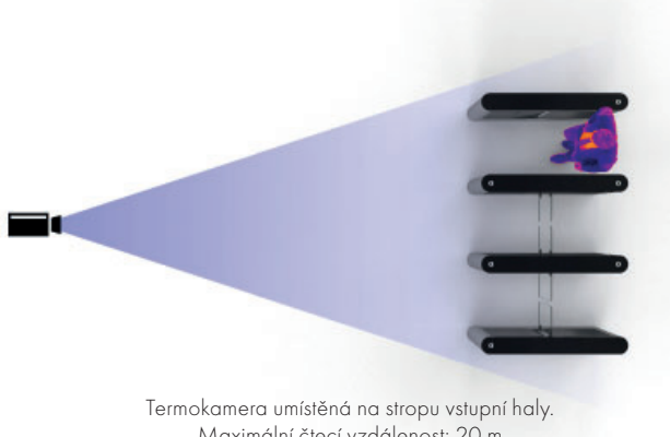
Termokamera umístěná na stropu vstupní haly. Maximální čtecí vzdálenost: 20 m

Termokamera může najednou snímat až 3 průchody turniketů.