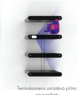
Termokamera umístěná přímo na turniketu