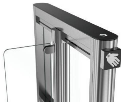
Senzor pro snímání teploty ze zápěstí - montáž v přední noze (model EasyGate SG 1000)