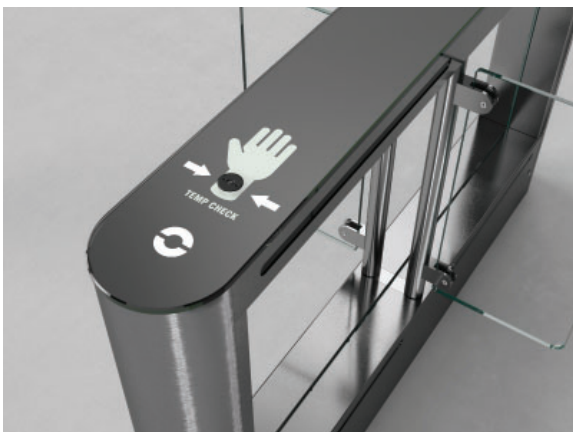
Senzor pro snímání teploty ze zápěstí - montáž v horním víku (model EasyGate SPD)

Systém měření teploty lze jednoduše zapnout/vypnout pomocí našeho ovládacího softwaru.