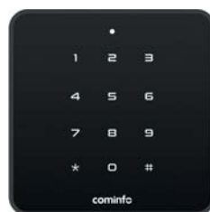
DUAL PIN CUBE