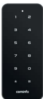
DUAL PIN LINE